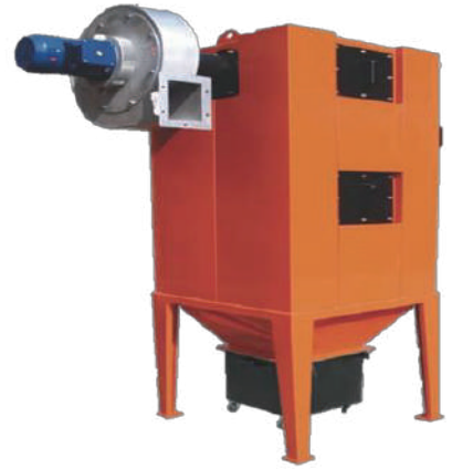
除塵装置サイクロン